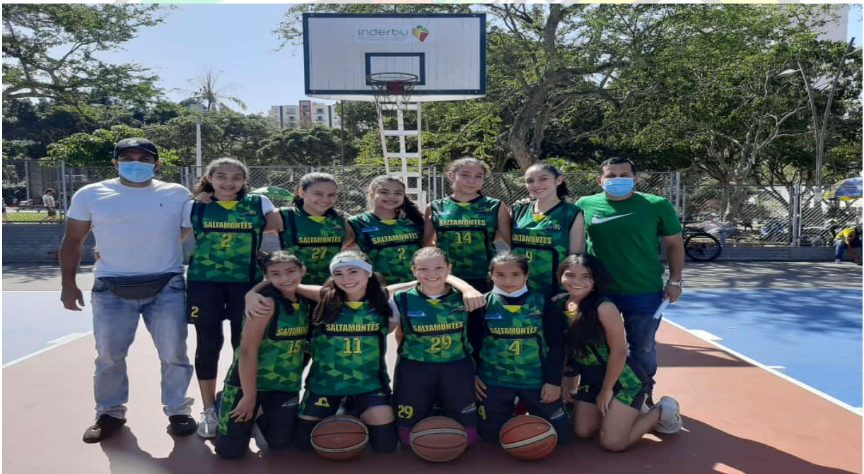
Febrero de 2021, inicio de la competencia, torneo Open Show categoría U15