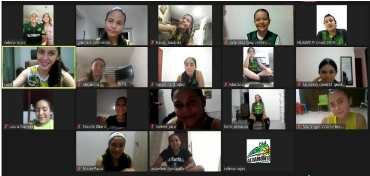
Entrenamiento físico y técnico en pandemia 2020