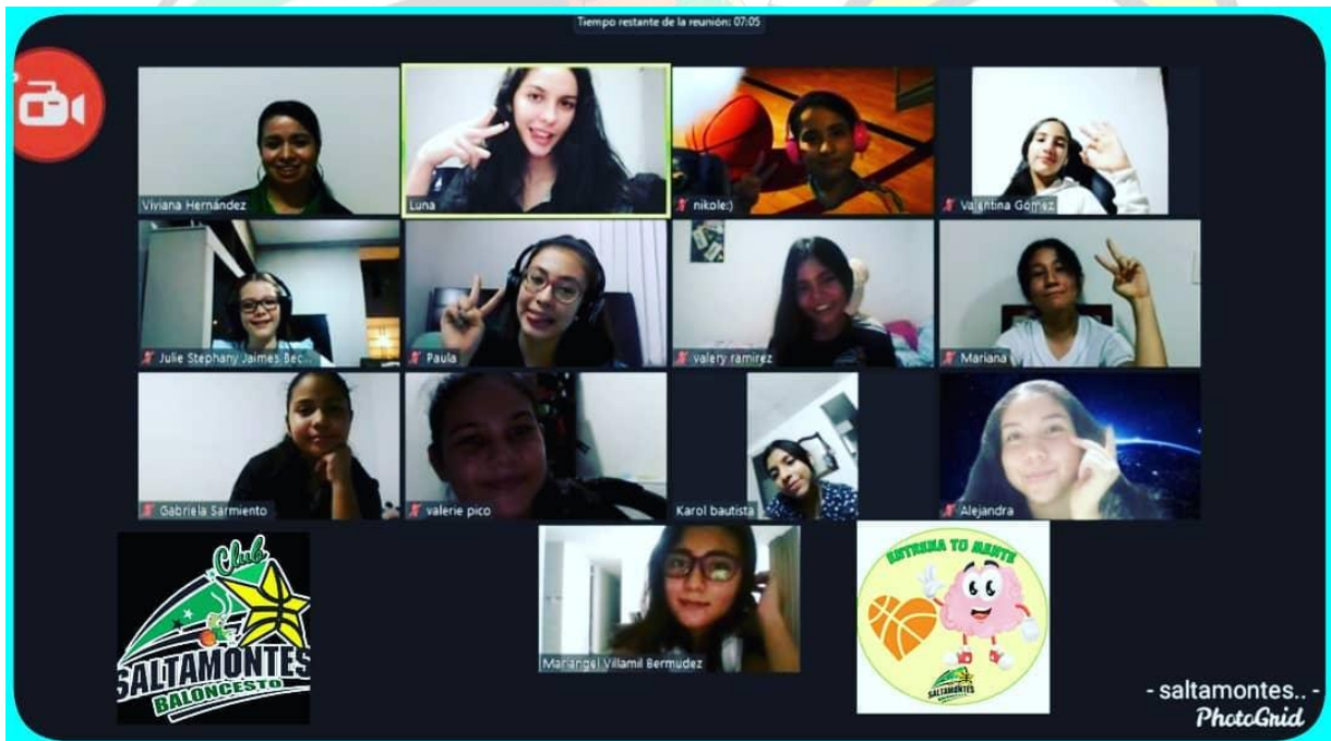
Entrenamiento mental en pandemia 2020