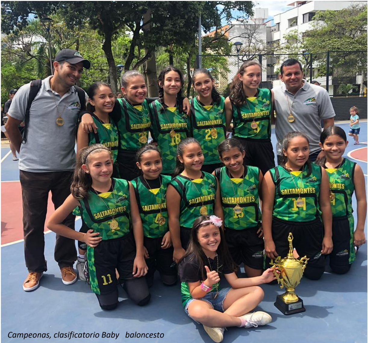
Campeonas, clasificatorio Baby baloncesto