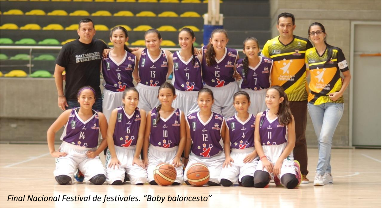
Final Nacional Festival de festivales. "Baby baloncesto"