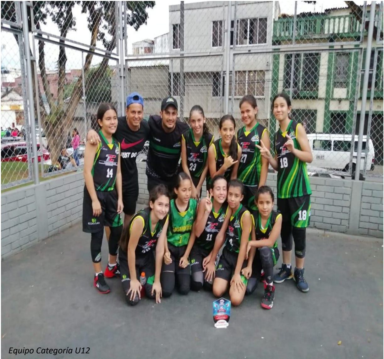
Equipo Categoría U12