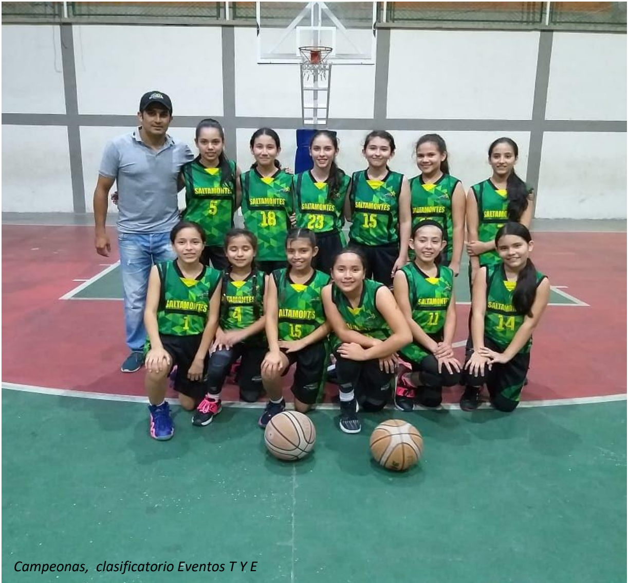
Campeonas, clasificatorio Eventos T Y E

Abril 07 de 2019, Piedecuesta Santander: