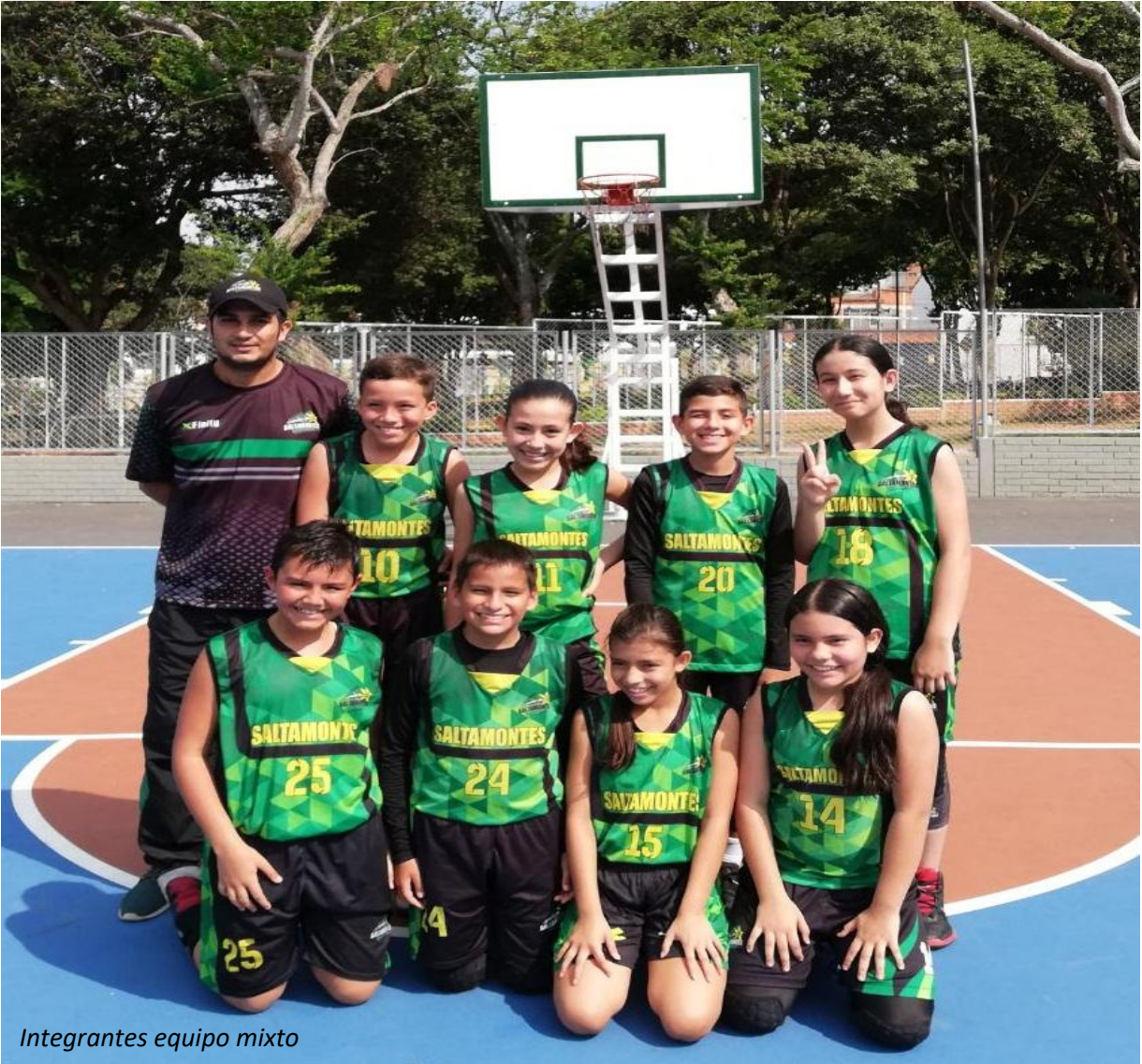
Integrantes equipo mixto