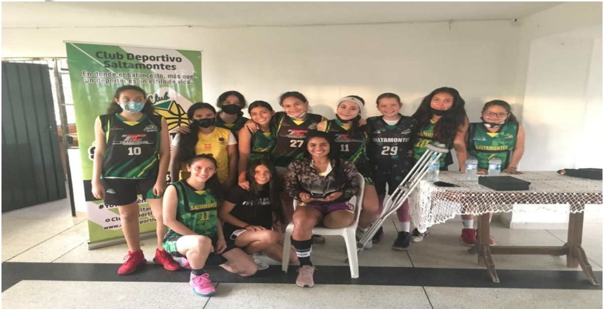
Noviembre de 2020, Motivación